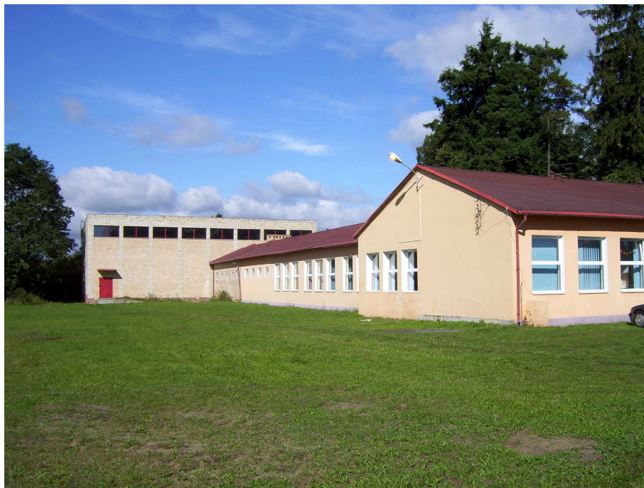
Budynek Szkoły Podstawowej w Wysokiej Kamińskiej

Istniejący teren przy Szkole Podstawowej w Wysokiej Kamińskiej umożliwia wybudowanie obiektów, które pozwolą stworzyć swoiste centrum edukacyjno-kulturalne i rekreacyjno-sportowe, w którym będzie się koncentrować życie mieszkańców Wysokiej Kamińskiej.