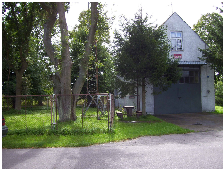
Budynek OSP w Wysokiej Kam. (przewidziany do rozbudowy).

Uzasadnienie projektu: Realizacja projektu przyczyni się do rozwiązania następujących problemów na terenie sołectwa: 1. Brak możliwości organizowania cyklicznych imprez kulturalnych, rekreacyjnych i sportowych przy braku odpowiedniej bazy lokalowej oraz obiektów rekreacyjno-sportowych; 2. Brak możliwości zagospodarowania wolnego czasu dla większej liczby dzieci, młodzieży i dorosłych. Powstanie centrum społeczno-kulturalnego, a także boisk oraz placu zabaw dla dzieci są obecnie najbardziej oczekiwanymi zadaniami przez mieszkańców wsi; 3. Alkoholizm spowodowany m.in. brakiem alternatywnych form spędzania wolnego czasu; 4. Migracja młodzieży - zauważa się większy udział ludności odpływającej z terenu wsi niż napływającej. Utworzenie centrum integracyjnego zachęci młodzież do zamieszkania na jej terenie; 5. Zbyt małe zainteresowanie turystów sołectwem Wysoka Kamińska - realizacja projektu podniesie walory turystyczno-rekreacyjne obu wsi i przyczyni się do rozwoju turystyki i agroturystyki; 6. Brak poczucia przynależności do społeczności sołectwiej, brak poczucia jedności ogranicza wspólne kultywowanie i podtrzymywanie tradycji lokalnych.