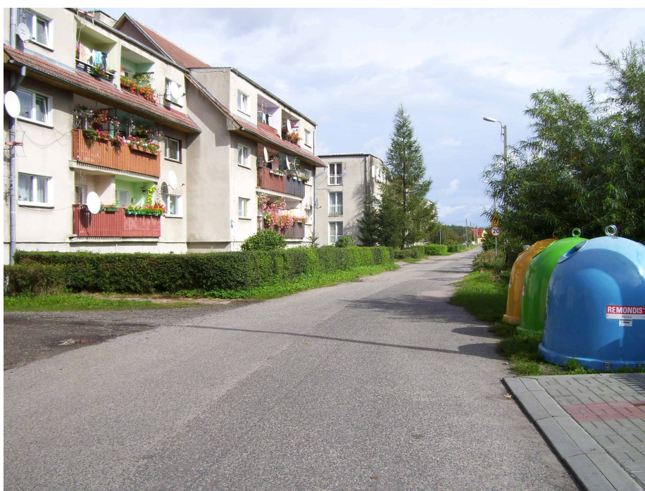
Ulica w Wysokiej Kamińskiej

Na terenie Wysokiej Kamińskiej brak jest obiektów zarejestrowanych w rejestrze zabytków. Spośród kilkunastu obiektów chronionych najciekawszym jest zespół zabudowań dworca kolejowego powstały w latach 1890-92 (budynek stacyjny, magazyn, poczta, szalet, budynek gospodarczy).