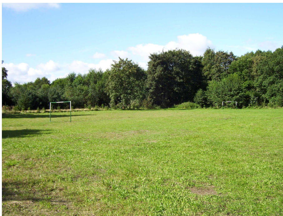
Aktualny stan zagospodarowania terenu przy szkole podstawowej

Projekt przewiduje wybudowanie na terenie przyszkolnym (przy Szkole Podstawowej w Wysokiej Kam.) samodzielnego obiektu mieszczącego m.in. bibliotekę wiejską, pracownię (kawiarenkę) internetową, świetlicę wiejską oraz salę spotkań mieszkańców.