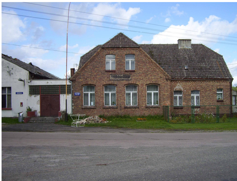
Obecna siedziba Filii Miejsko-Gminnej Biblioteki Publicznej w Wysokiej Kamińskiej